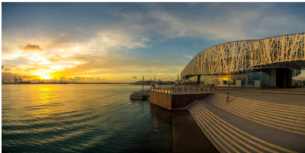
Mémorial ACTe, Pointe-à-Pitre